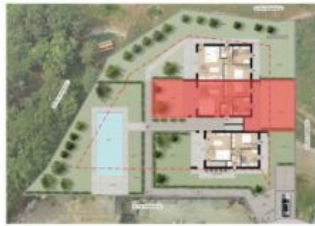
Inserimento nel lotto