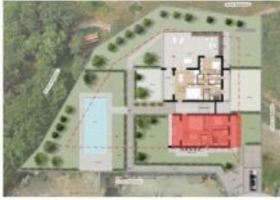
Inserimento nel lotto