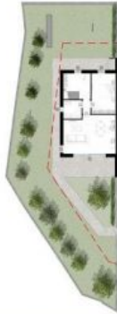
Giardino privato TOT. 223,75 mq