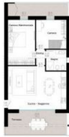
Terrazzo e balcone TOT. 23,92 mq