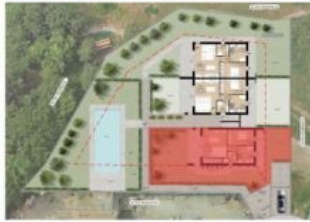
Inserimento nel lotto