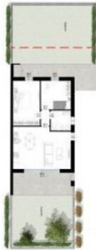
Giardino privato TOT. 100,31 mq