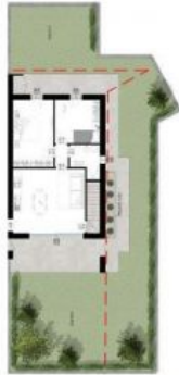
Giardino privato TOT. 155,29 mq