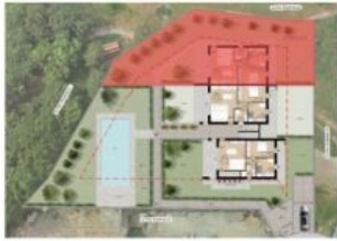
Inserimento nel lotto